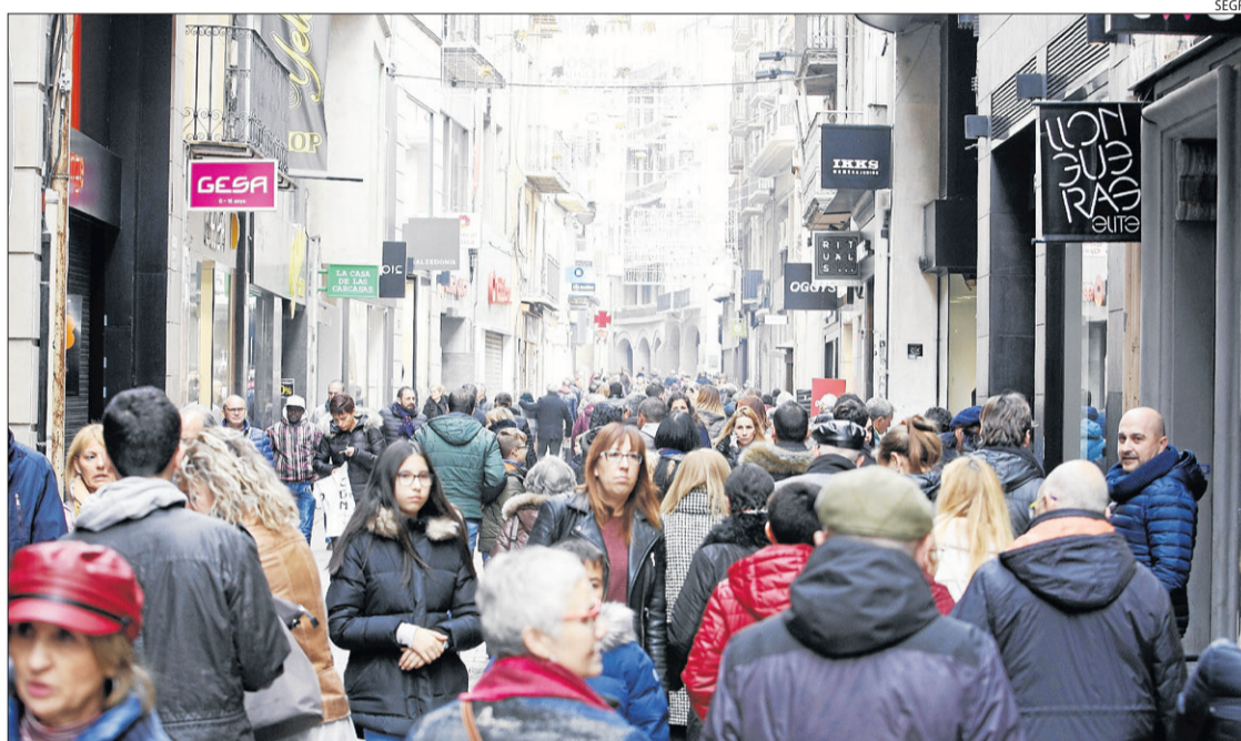
Imatge d'arxiu de l'Eix Comercial de Lleida.

L'IPC a Catalunya va pujar vuit dècimes a l'octubre respecte al setembre i la taxa interanual es va mantenir en el 0,3%, segons dades l'INE.