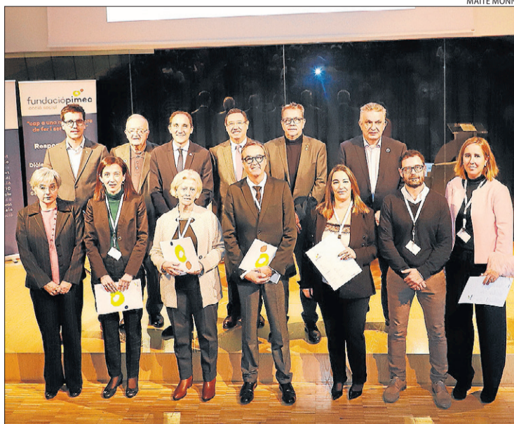
Pimec va reconèixer ahir els seus socis més antics de Lleida.

sitivament el principi d'acord entre el PSOE i Unides Podem perquè "l'important és que es comenci a governar com més aviat millor". Va reclamar al futur Executiu espanyol una fiscalitat específica per a les pimes, l'aplicació d'un règim sancionador de la morositat i un "preu just" de l'energia que permeti a les pimes "ser competitives". Durant el fòrum es van lliurar reconeixements als socis més antics de Pimec Lleida.